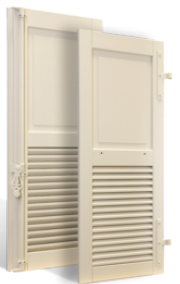
VOLETS BATTANTS GRASSE à LAMES à LA FRANÇAISE en BOIS EN SAVOIR PLUS