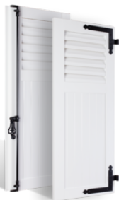
VOLETS BATTANTS 36mm à LAMES à LA FRANÇAISE AU TIERS en PVC EN SAVOIR PLUS