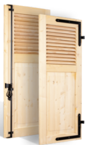
VOLETS BATTANTS 32mm à LAMES à LA FRANÇAISE AU TIERS en BOIS EN SAVOIR PLUS