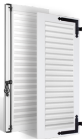
VOLETS BATTANTS 36mm à LAMES à LA FRANÇAISE en PVC EN SAVOIR PLUS