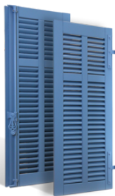
VOLETS BATTANTS CANNES à LAMES à LA FRANÇAISE en BOIS EN SAVOIR PLUS