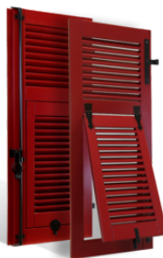
VOLETS BATTANTS NIÇOIS à LAMES à LA FRANÇAISE en BOIS EN SAVOIR PLUS