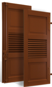
VOLETS BATTANTS COLMAR à LAMES à LA FRANÇAISE en BOIS EN SAVOIR PLUS