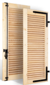
VOLETS BATTANTS 32mm à LAMES à LA FRANÇAISE en BOIS EN SAVOIR PLUS